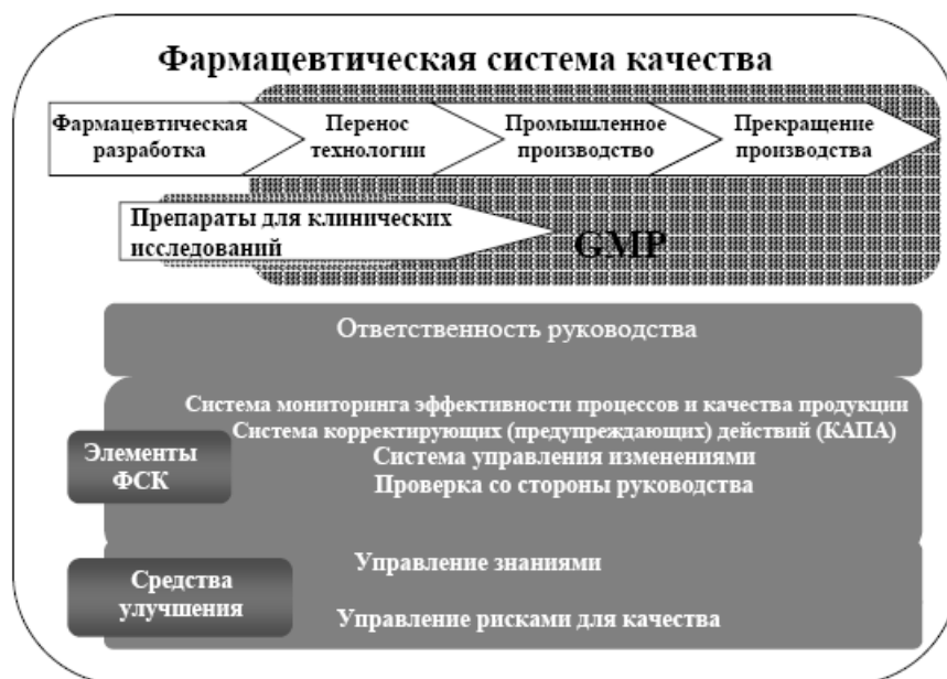
СХЕМА МОДЕЛИ ФАРМАЦЕВТИЧЕСКОЙ СИСТЕМЫ КАЧЕСТВА

На схеме показаны основные особенности модели фармацевтической системы качества (далее - ФСК). ФСК охватывает весь жизненный цикл продукции, включая фармацевтическую разработку, перенос технологии, промышленное производство и прекращение производства.